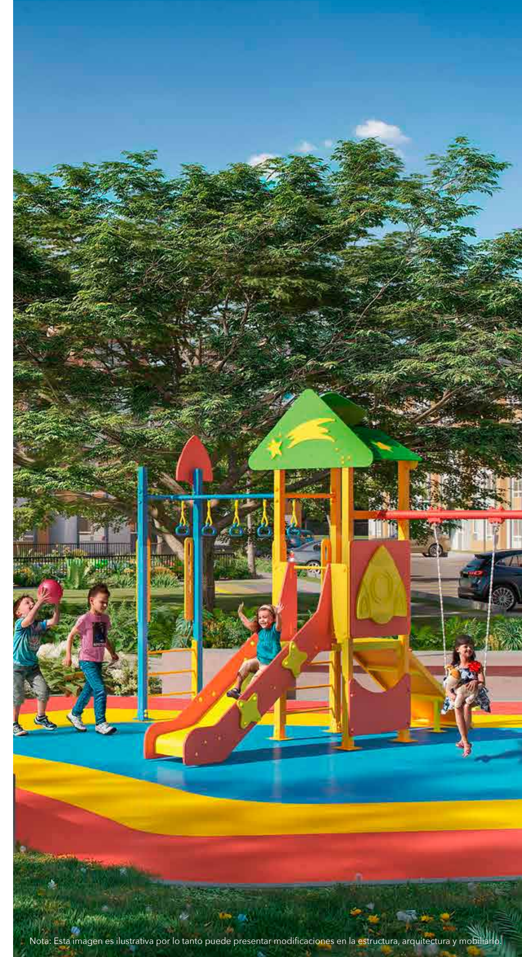
Nota: Esta imagen es ilustrativa por lo tanto puede presentar modificaciones en la estructura, arquitectura y mobiliario.