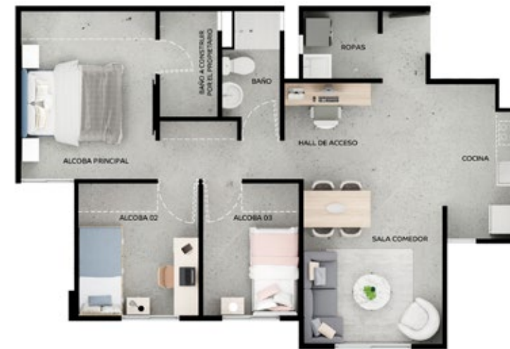
ASÍ LO PUEDES DEJAR