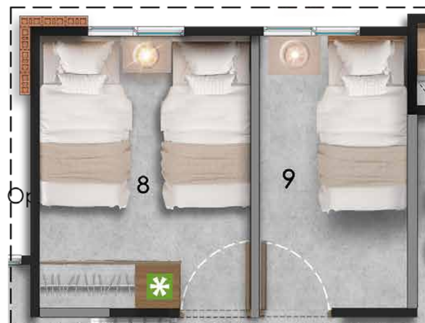
Opción Para Futuro Desarrollo - Estudio