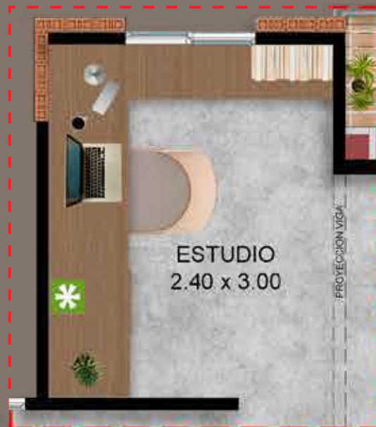
Opción para futuro desarrollo - Estar TV