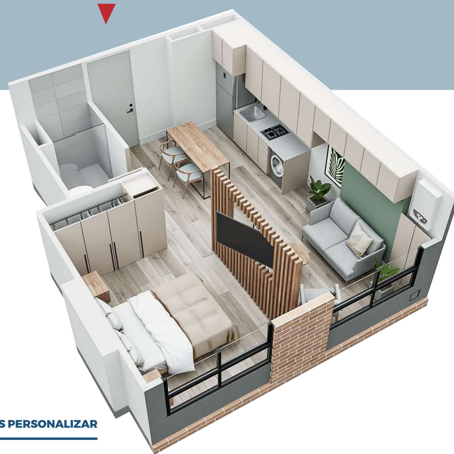
ASÍ LO PUEDES PERSONALIZAR