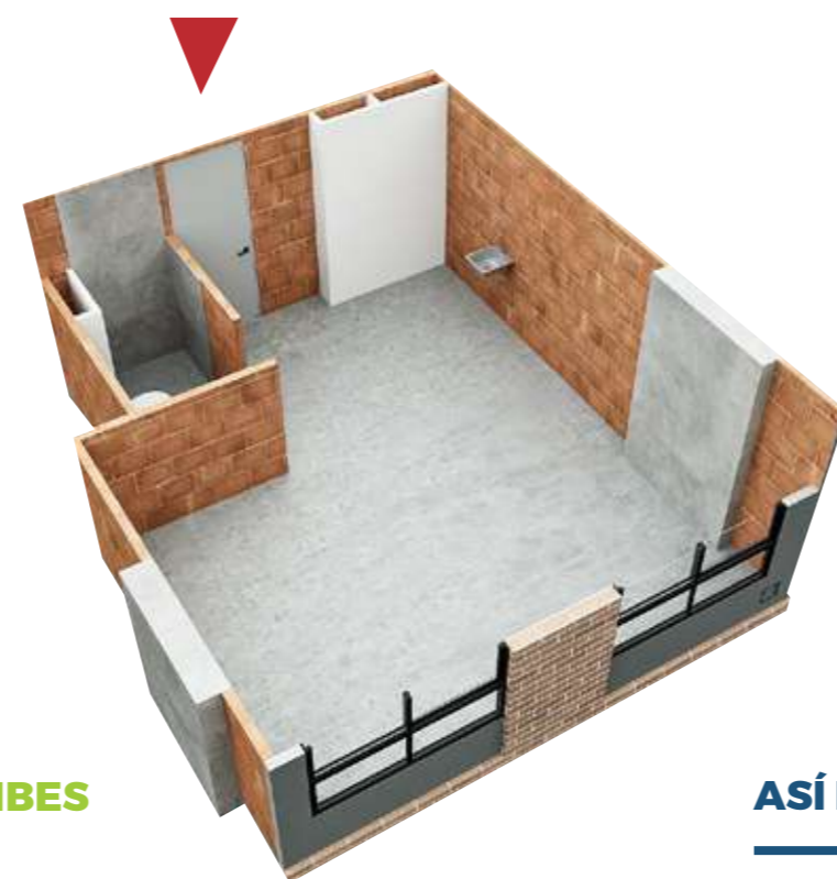
ASÍ LO RECIBES