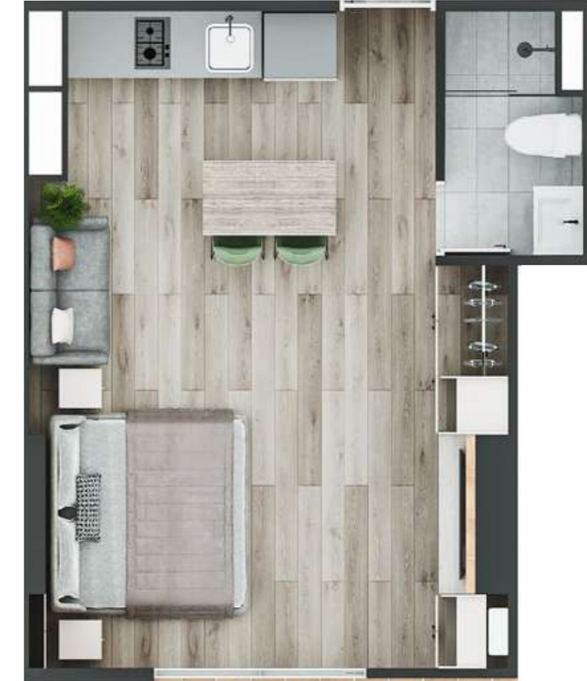
ASÍ LO PUEDES PERSONALIZAR