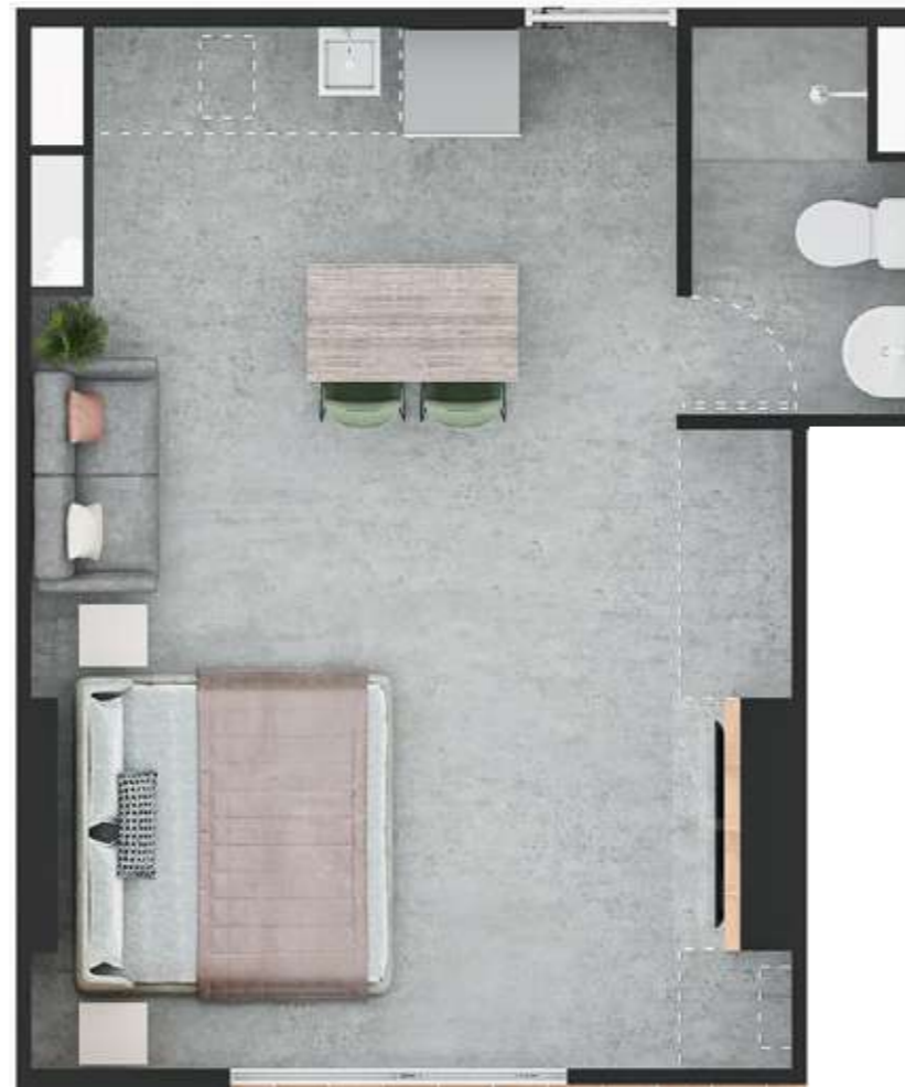
ASÍ LO RECIBES