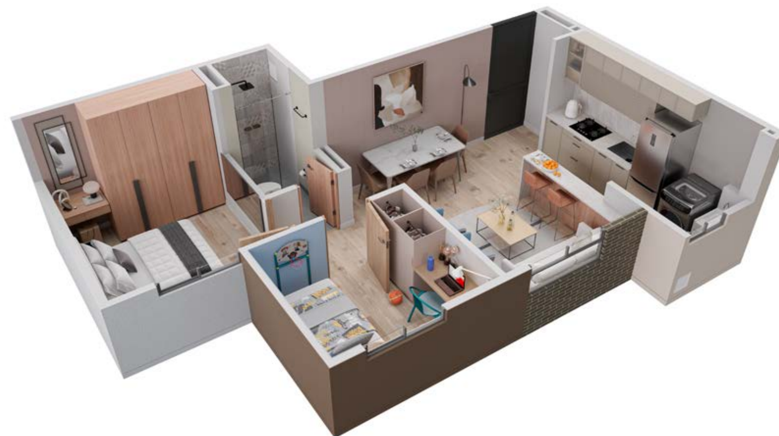
ASÍ LO PUEDES DEJAR