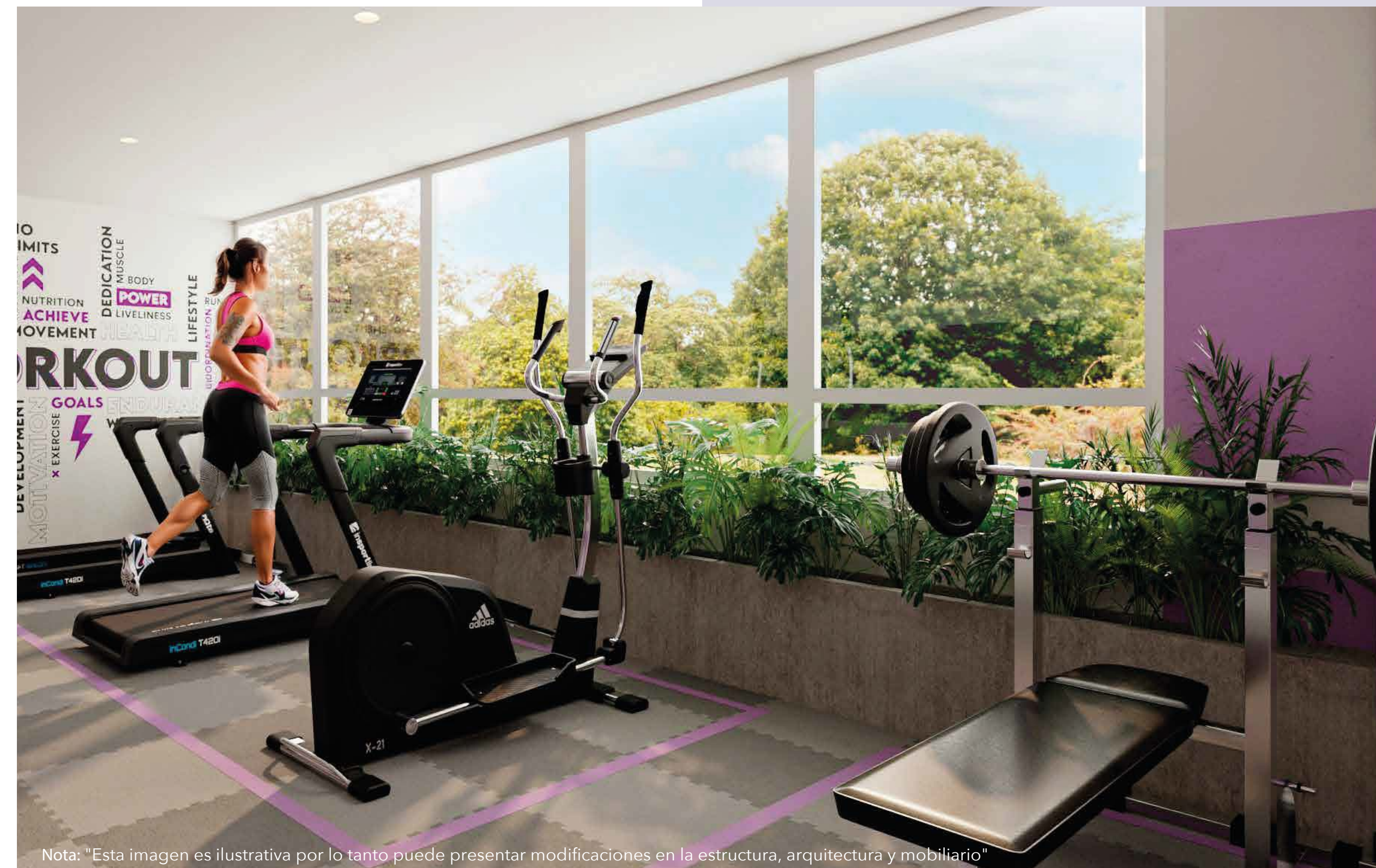
Nota: "Esta imagen es ilustrativa por lo tanto puede presentar modificaciones en la estructura, arquitectura y mobiliario"