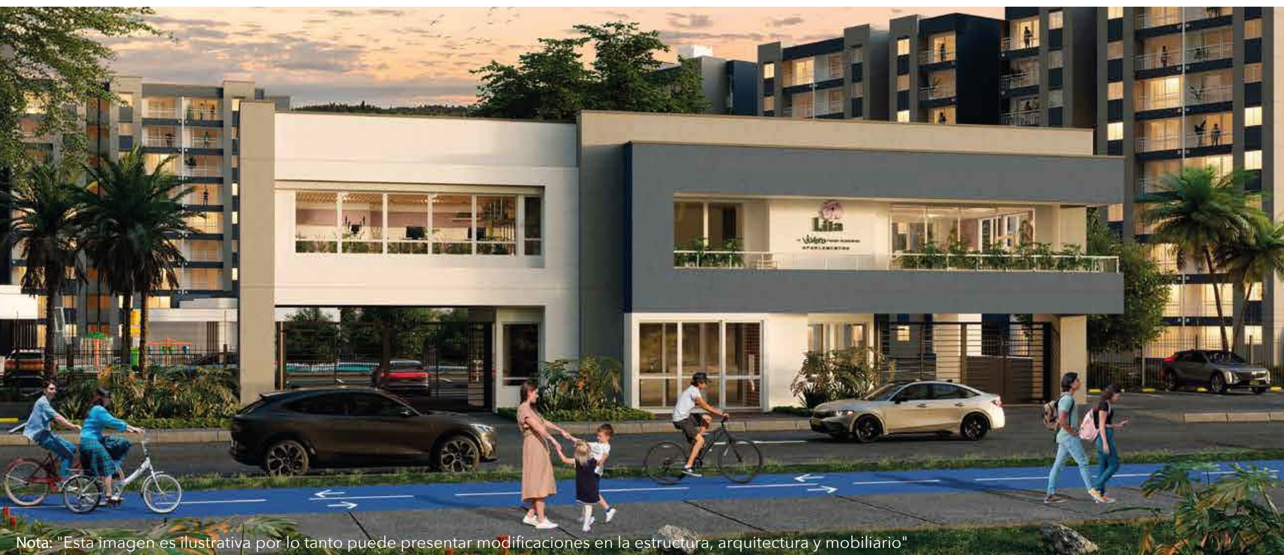
Nota: "Esta imagen es ilustrativa por lo tanto puede presentar modificaciones en la estructura, arquitectura y mobiliario"