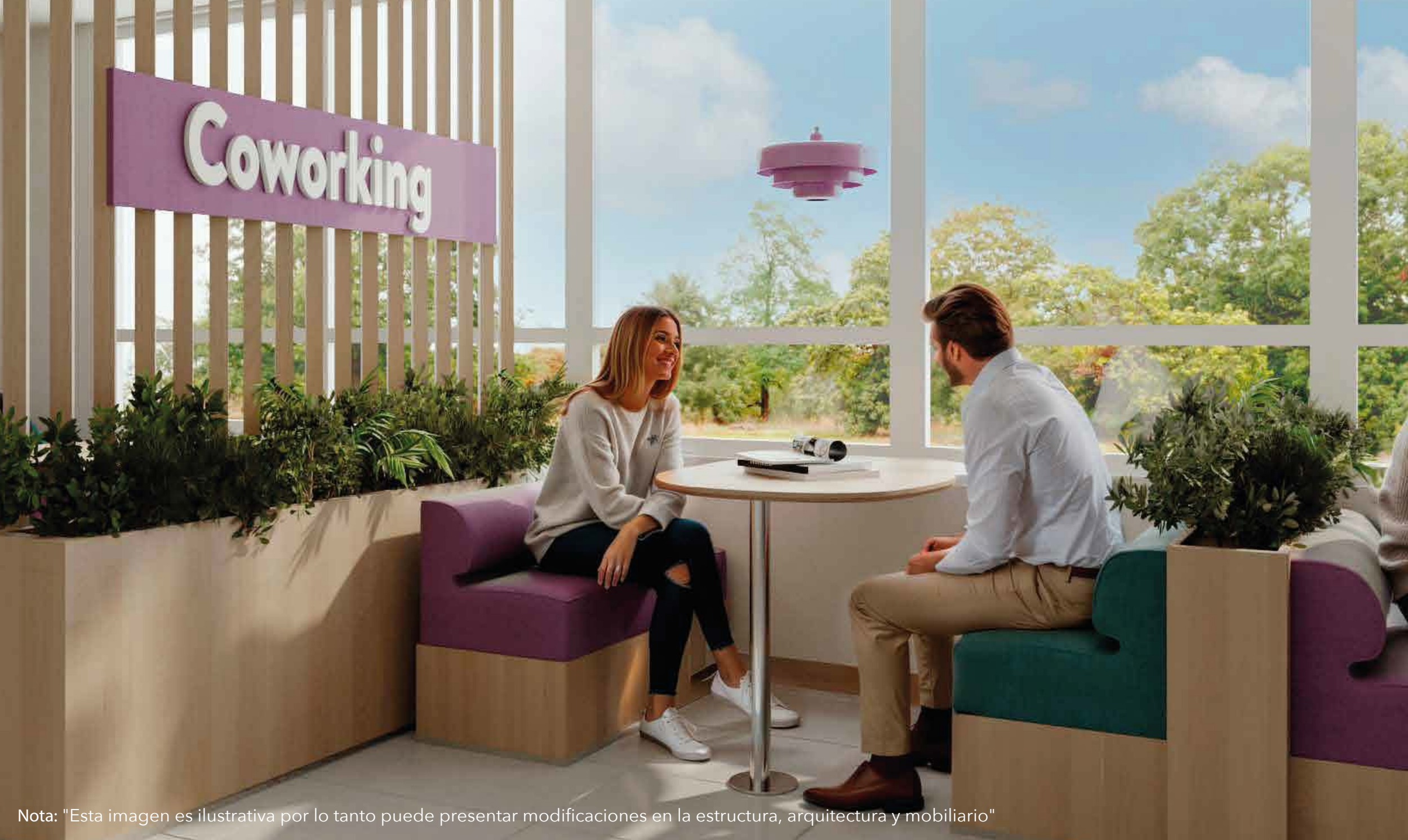
Nota: "Esta imagen es ilustrativa por lo tanto puede presentar modificaciones en la estructura, arquitectura y mobiliario"