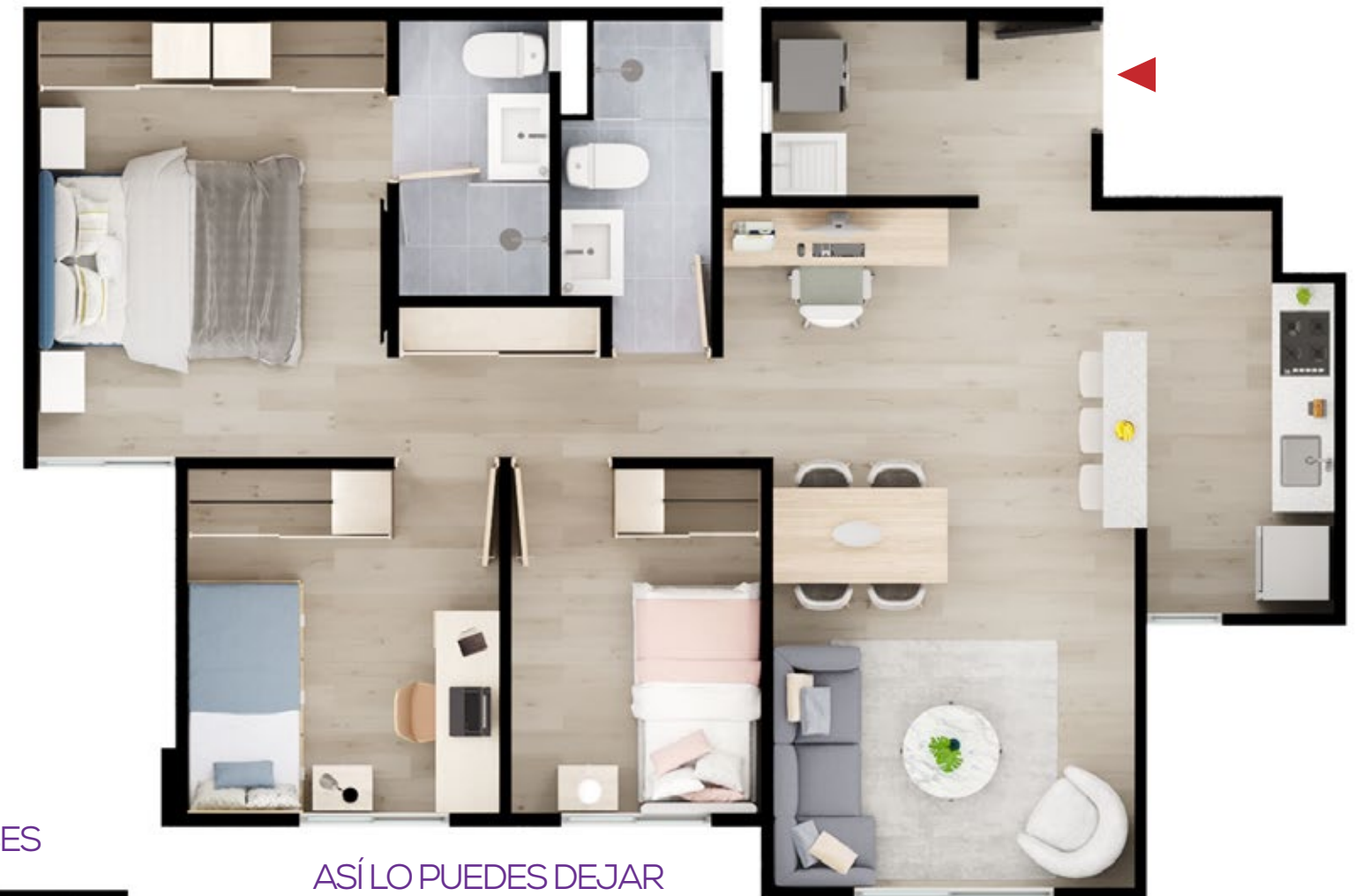
ASÍ LO RECIBES