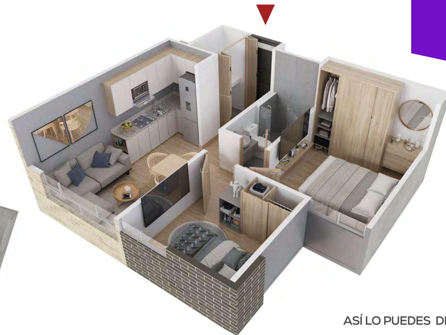
ASÍ LO PUEDES DEJAR