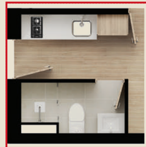
Opción Lock off