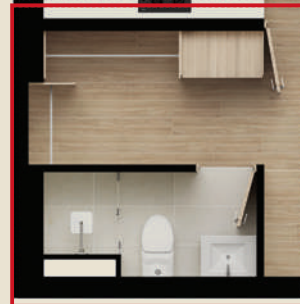
Opción sin Lock off