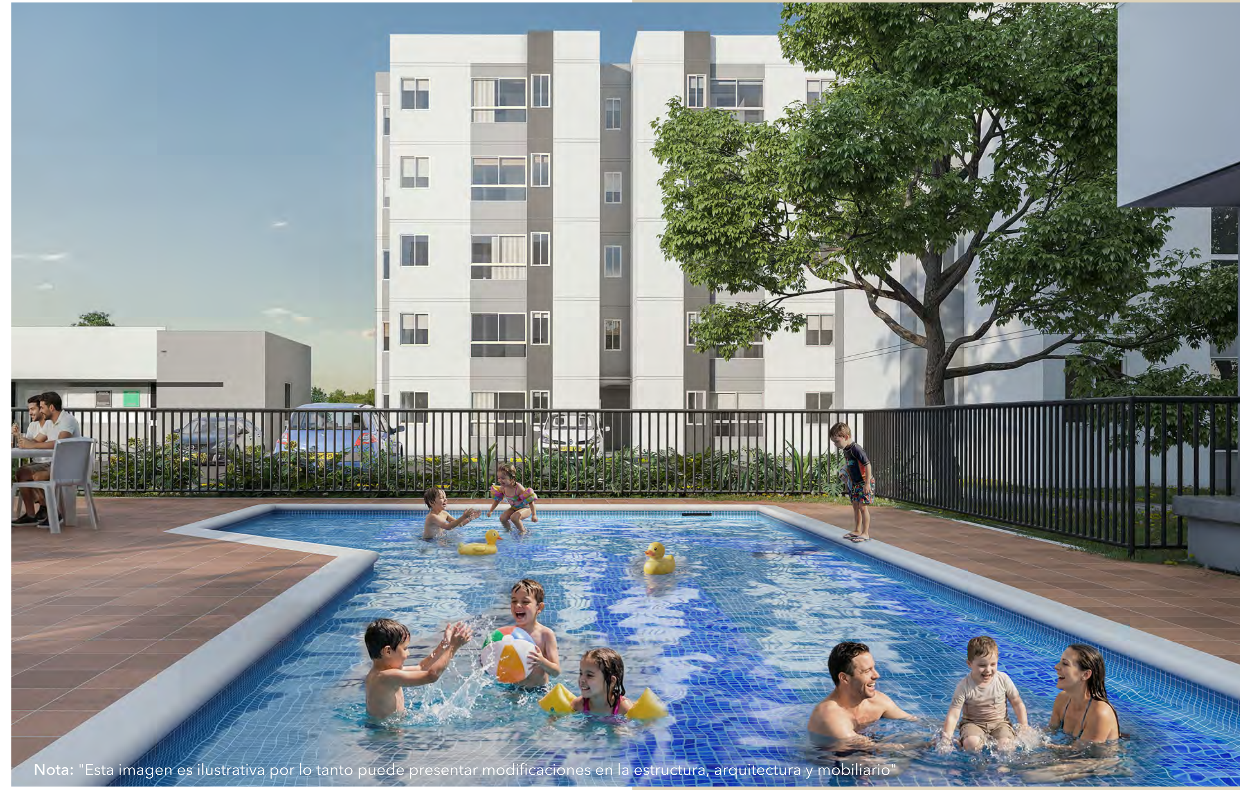
Nota: "Esta imagen es ilustrativa por lo tanto puede presentar modificaciones en la estructura, arquitectura y mobiliario"