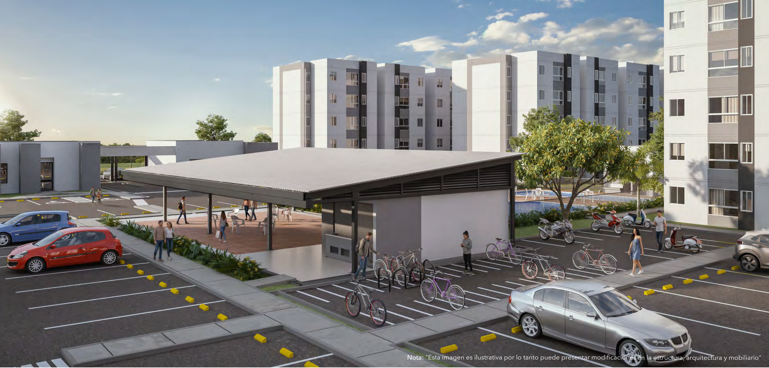
Nota: "Esta imagen es ilustrativa por lo tanto puede presentar modificaciones en la estructura, arquitectura y mobiliario"