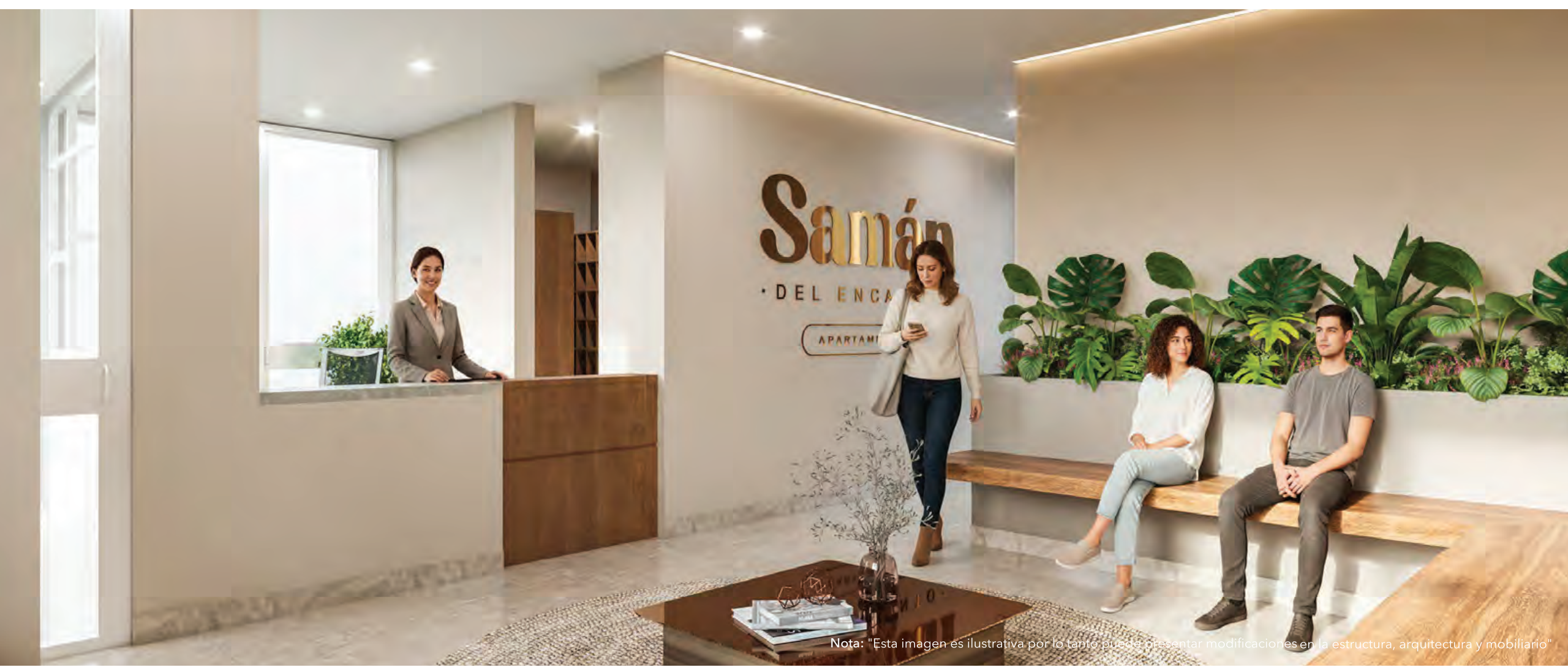
Nota: "Esta imagen es ilustrativa por lo tanto puede presentar modificaciones en la estructura, arquitectura y mobiliario"